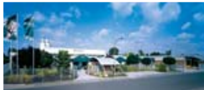
Silikal, Produktion und Verwaltung in Mainhausen